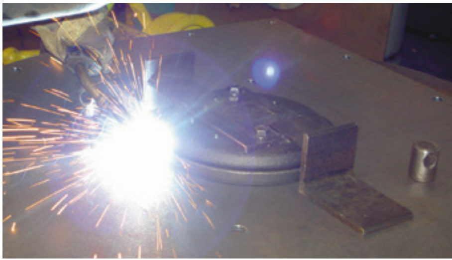
Komplettierung von Baugruppen für den Fahrzeugbau