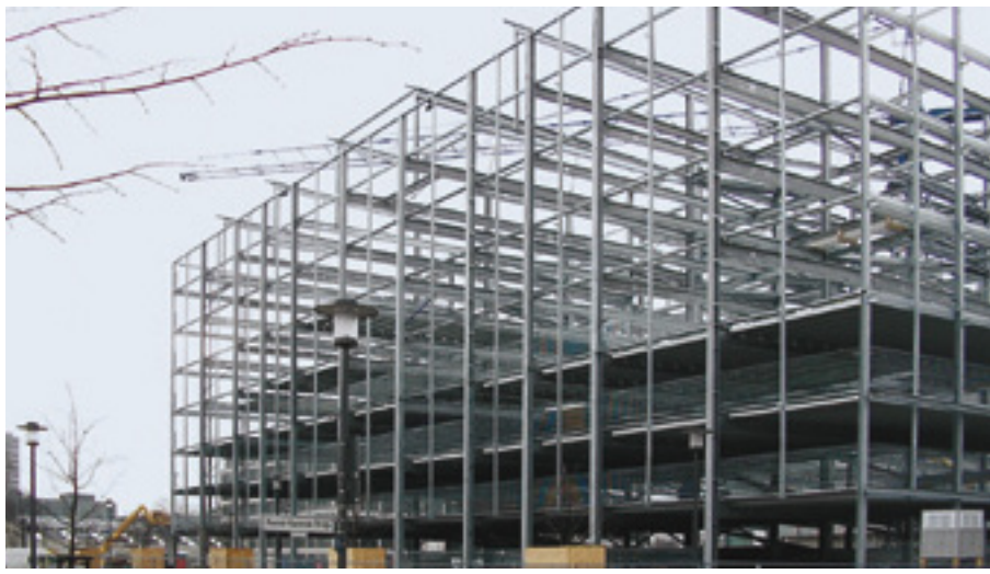
Parkhaus in Stahlverbundbauweise