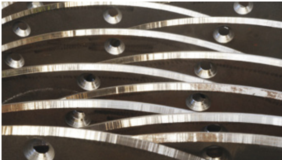
Mechanische Bearbeitung von gebranntem Flachmaterial