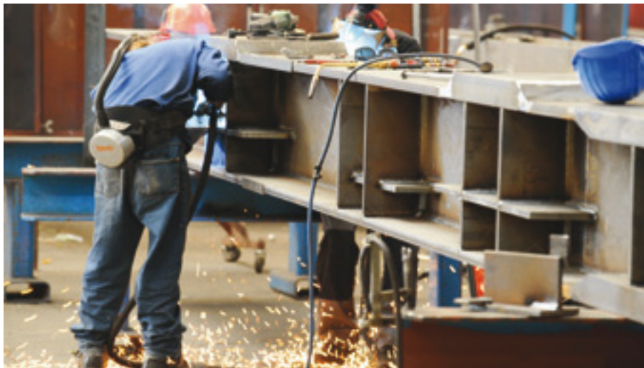
Vollwandschweißkonstruktion nach statischen Erfordernissen