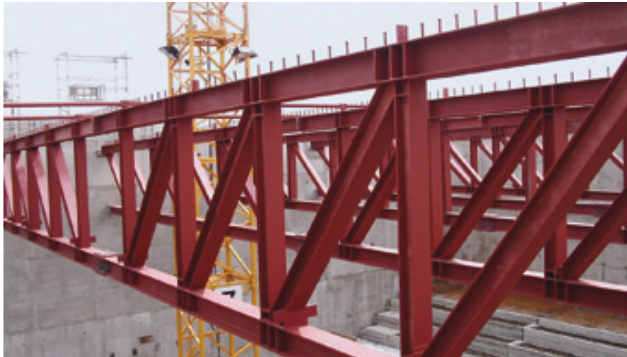
Stahlfachwerkbinder aus Walzprofilstählen mit Kopfbolzen auf dem Obergurt