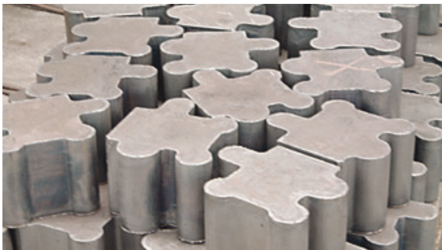
Autogengebrannte Rohlinge für den Maschinenbau