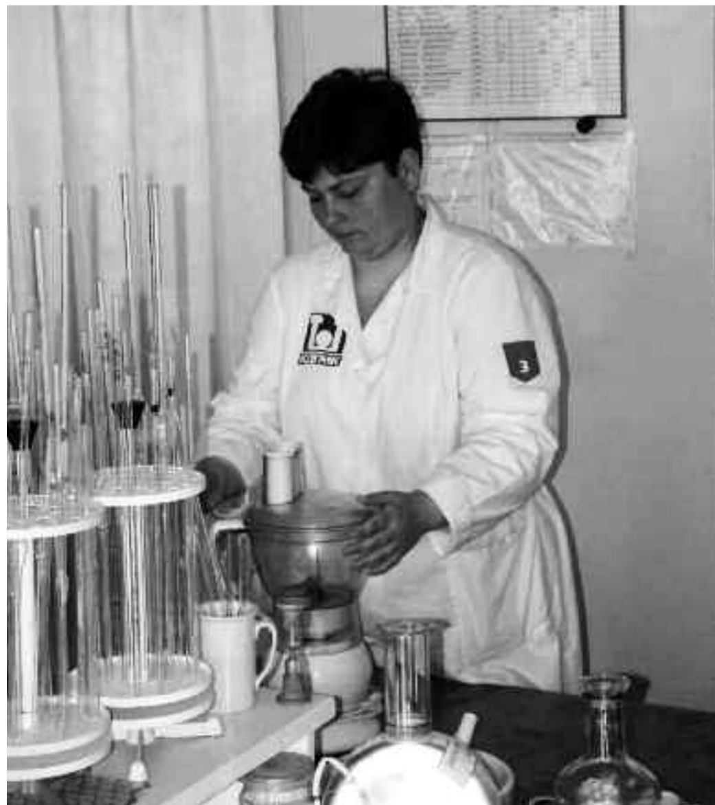
Hygienická laboratoř v ukrajinském ArcelorMittal Krivoj Rog