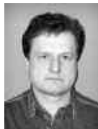
Karel Staniševský závod 14