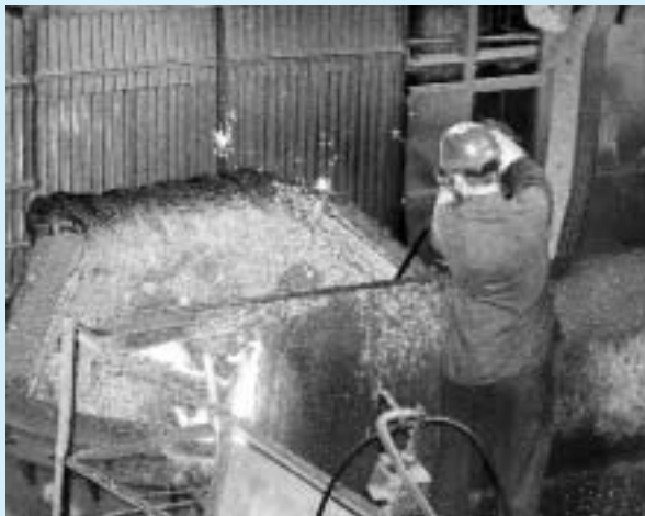
I když je v ocelárně většina činností automatizovaná, bez zásluhy lidské ruky se výroba oceli neobejde.

Výsledky se už dostavily, i když ke splnění hlavního úkolu – vyrábět měsíčně tři sta tisíc tun oceli, ještě něco