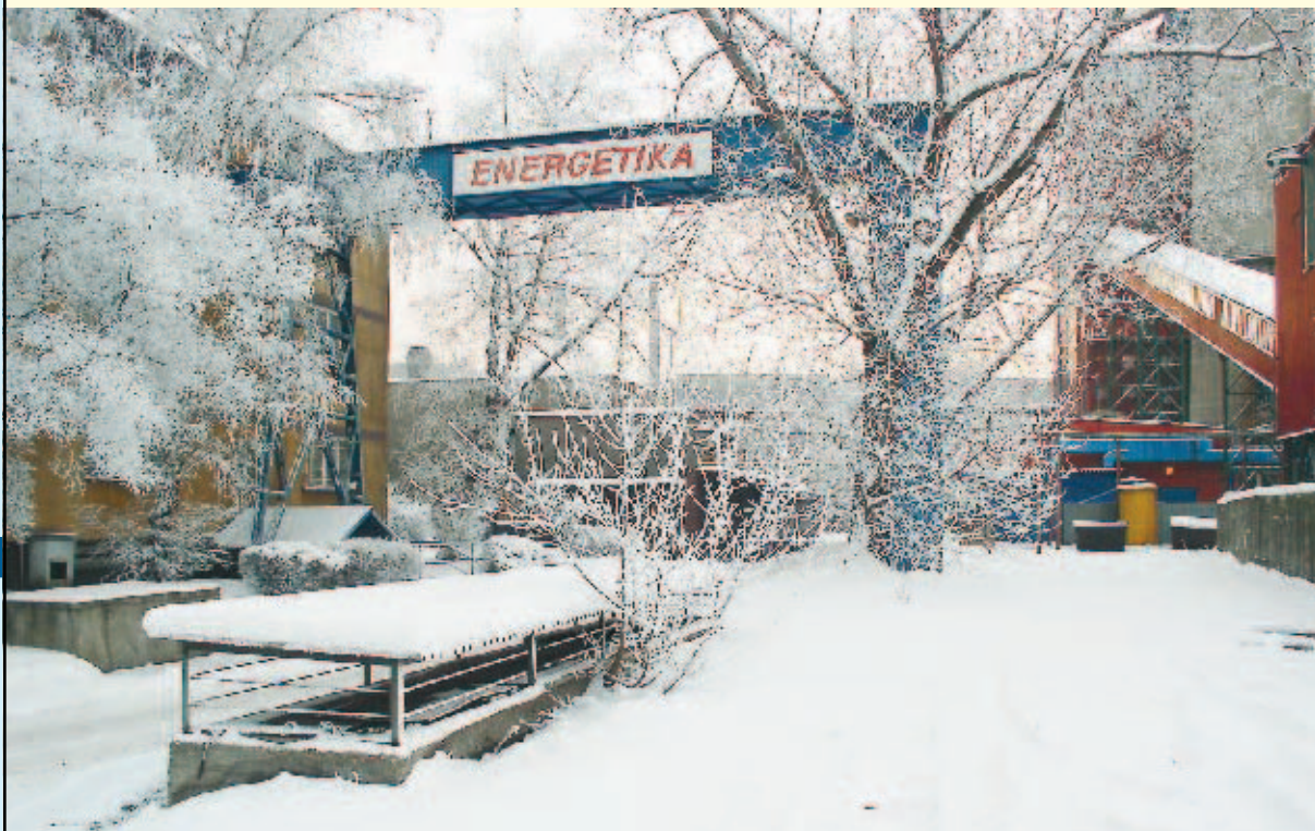
Energetici si s problémy, které přinesla zima, dokázali poradit.