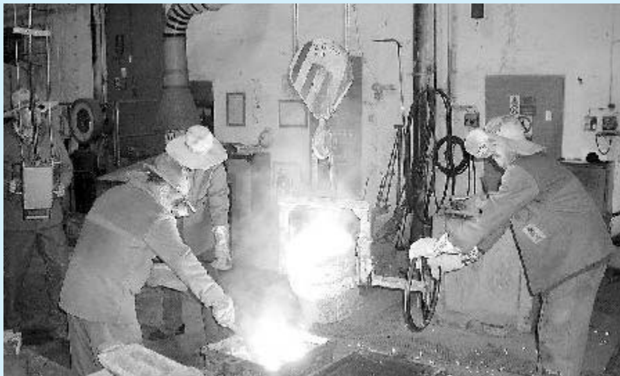
Hutní poloprovoz skončil v červenci

celkem 5801 zaměstnanců společnosti Ispat Nová huť podle nových stanov třetinu členů dozorčí rady. Z voleb vzešla jména tří osob, které budou po dobu tří let jako zástupci zaměstnanců v dozorčí radě INH dohlížet na dodržování zákonných norem v souvislosti s podnikatelskou činností společnosti.