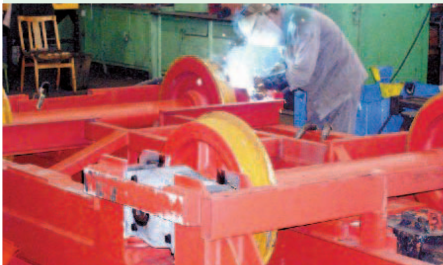
Poslední podvozek v dílně. Před Štědrým dnem bylo hotovo všech dvanáct.