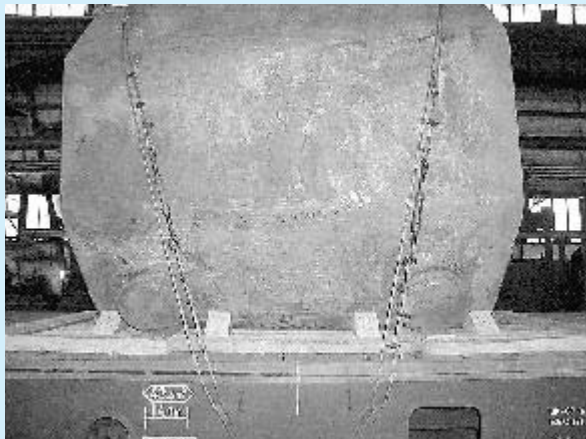
Padesátitunový odlitek zamířil v únoru do Německa

Historicky první „KIP Meeting“ na půdě společnos-