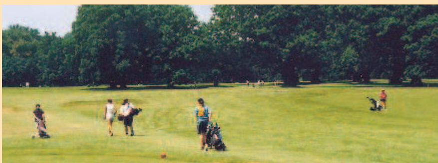
S rokem 2003 byli spokojeni hlavně golfisté Park Golf Clubu NH Ostrava

Kadetky skončily druhé, čekala je kvalifikace do nejvyšší soutěže.