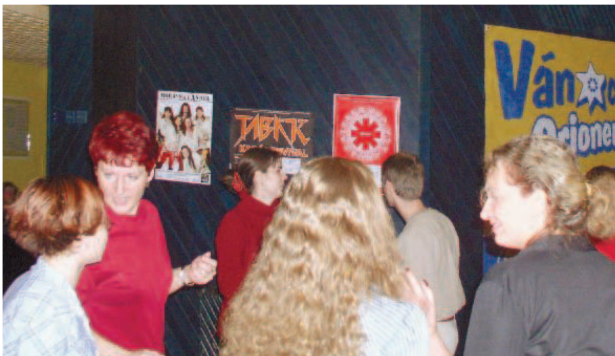
Do Altán klubu přicházejí nejen brunetky a zrzky, ale dokonce i zlatovlásky...

Láska, sex a žárlivost v komedii, to je ústřední téma divadelního představení 5. února 2004. Stojí za vaši pozornost. (pa)